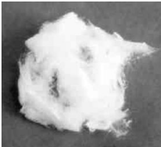
Figura 2 Lana mineral

Por sus aplicaciones en el intervalo de temperaturas de trabajo en campo de los aislamientos se diferencian los siguientes tipos de fibras entre las FMA con estructura vítrea: