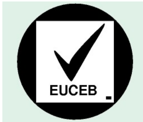
Figura 5 Etiqueta EUCEB para las fibras biosolubles

Para poder certificar la composición y los resultados de los ensayos de estas nuevas fibras y asegurar que se mantiene su calidad, los fabricantes han creado un sistema voluntario de autocertificación denominado EUCEB (European Certification Board for mineral wool). Todos los ensayos y supervisiones de procedimientos y procesos implicados son realizados por laboratorios e instituciones especializadas independientes y las fibras biosolubles certificadas llevan la etiqueta EUCEB. Ver figura 5.