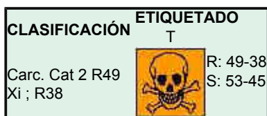
Figura 4 Clasificación y etiquetado de las lanas minerales